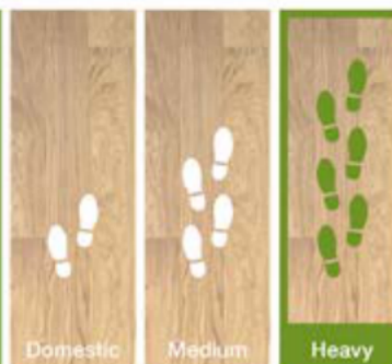
Domestic Medium Heavy